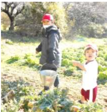
ブロッコリーの収穫